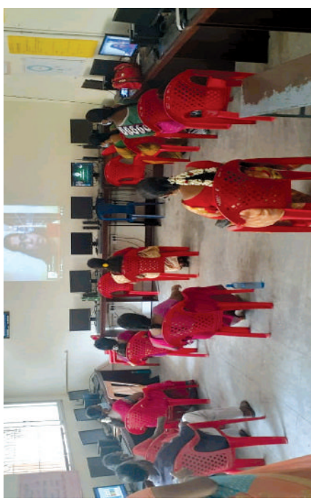
முதுகலை ஆசிரியர்களுக்கு உயர் தொழில்நுட்ப ஆய்வகம் வழியாகப் பயிற்சி நடைபெறுகல்.